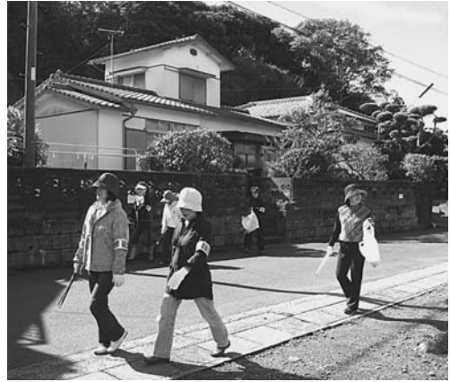
ゴミ拾いをする女性部会員

女性部会の活動は、部会員相互の親睦を図りながら、会員個々の研鑽を重ねることとありますが、一方では親会が求めておられる地域社会への貢献活動も今後の活動の中で大きな比重を占めるものと考えています。